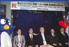
▲2009年11月 釜山アクアリウムとの姉妹館締結5周年