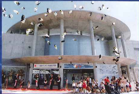
▲開館セレモニー(2001年4月22日)

本企画展では、これまでの水族館のイベントや新施設、姉妹館締結を結んでいる韓国釜山アクアリウムとの交流やペンギン誕生秘話etc...10年間の歴史を写真やパネルで一挙にご紹介いたします。また、長崎の里山を再現した自然体験ゾーン・ビオトープ10年の足跡をはじめ、過去に開催した特別企画展で人気のあった展示品や水族館オリジナルグッズの数々も必見です。