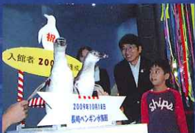
▲2009年10月 入館者200万人達成