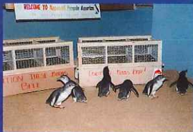
▲2005年4月 コガタペンギン6羽が初入館