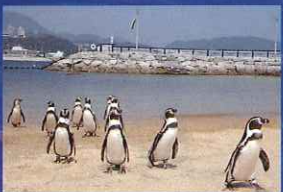
▲2009年7月 ふれあいペンギンビールオープン