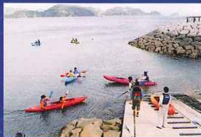
▲2004年4月 自然体験ゾーン海浜部オープン

長崎ペンギン水族館は、おかげさまで、2011年4月22日に開館10周年を迎えます。 これまでの10年間の歴史を振り返り、より一層みなさまから愛される水族館を目指します。