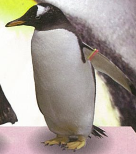
ジェンツー ペンギン