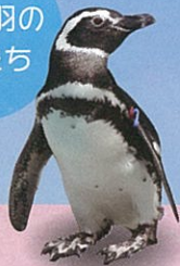
マゼラン ペンギン