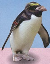
マカロニ ペンギン