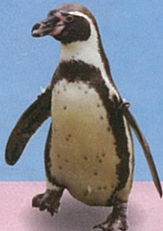
ファンボルト ペンギン