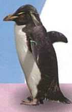
イワトビ ペンギン